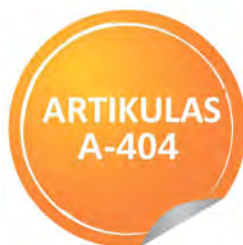
A-404 200 ml A-404-1 1000 ml