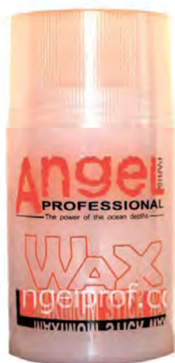
A-406 80 g